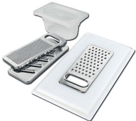
Kit râpes avec anneau de support et cuvette

* uniquement en combinaison avec l'accessoire 8644 101