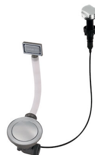
Vidange automatique Space - PE 8407 109