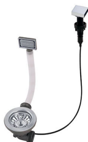
Vidange automatique - PM 8407 113