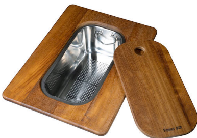
Planche de découpe Twin en bois Iroko avec tamis en acier inoxydable