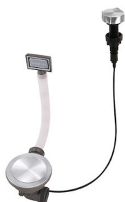
Vidange automatique Space Milano 8407 115