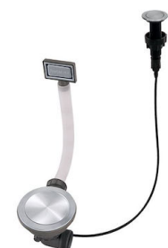
Vidange automatique Space Push - PP 8407 116