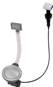
Vidange automatique Space - PA 8407 108