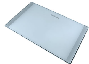
Planche de découpe en verre