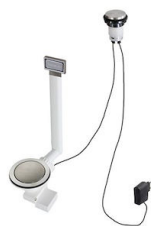
Vidange automatique Space Light - PL 8407 117